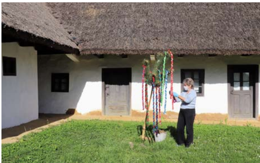
Májusfa díszítés Zalalövön

nélküli tanyára eljutni tárgygyűjtési céllal, hogy a leletmentés milyen felkészülést igényel, hogy egy-egy tárgy felkutatásához, mentéséhez, szállításához mennyi ember összehangolt munkája szükséges, milyen sok történet, élmény elevenedik fel a régi munkaeszközök, gépek bemutatásával. A kombájnt a vasgyűjtőbe leadás előtti napokban sikerült megmenteni, 2020. április 27-én, egy Debrecen melletti tanyáról.”