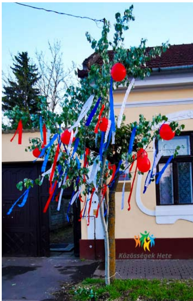
Elek májusfája a Szlovák Önkormányzat épülete előtt

https://docs.google.com/forms/d/e/1FAIpQLSc5SjWWjGNGgsUqCn7q7CWYltszV-kST6SRPgvgJged080ApA/viewform