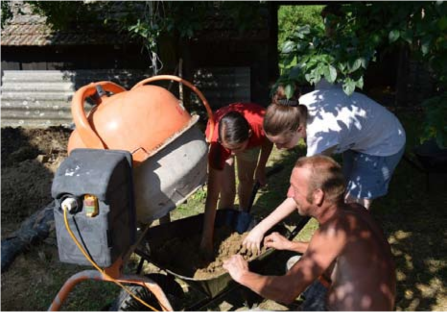
A hagyomány és a modernitás találkozása