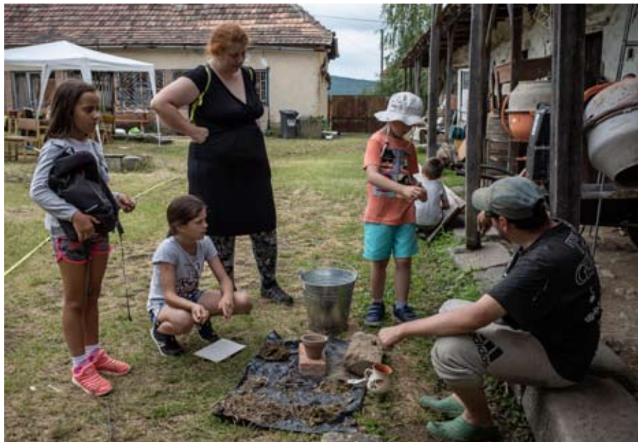
Hogyan lesz a sárból lakóház