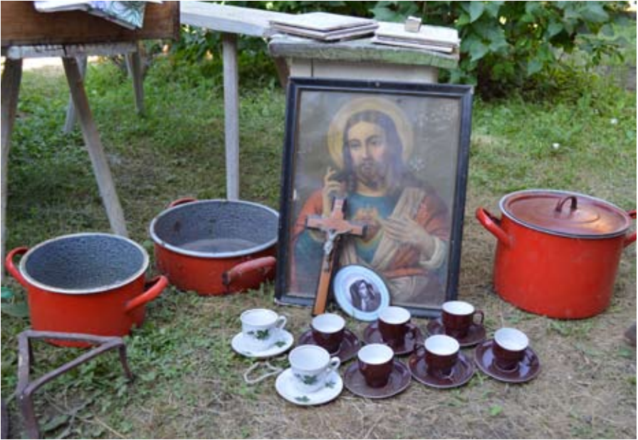
Épül a gyűjtemény