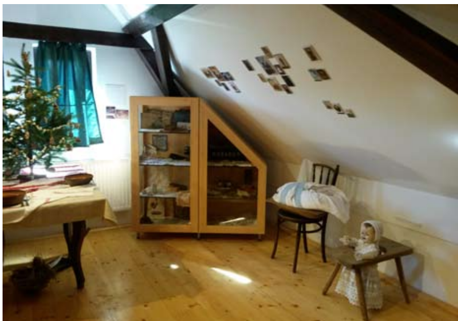
Részletek a kiállításból