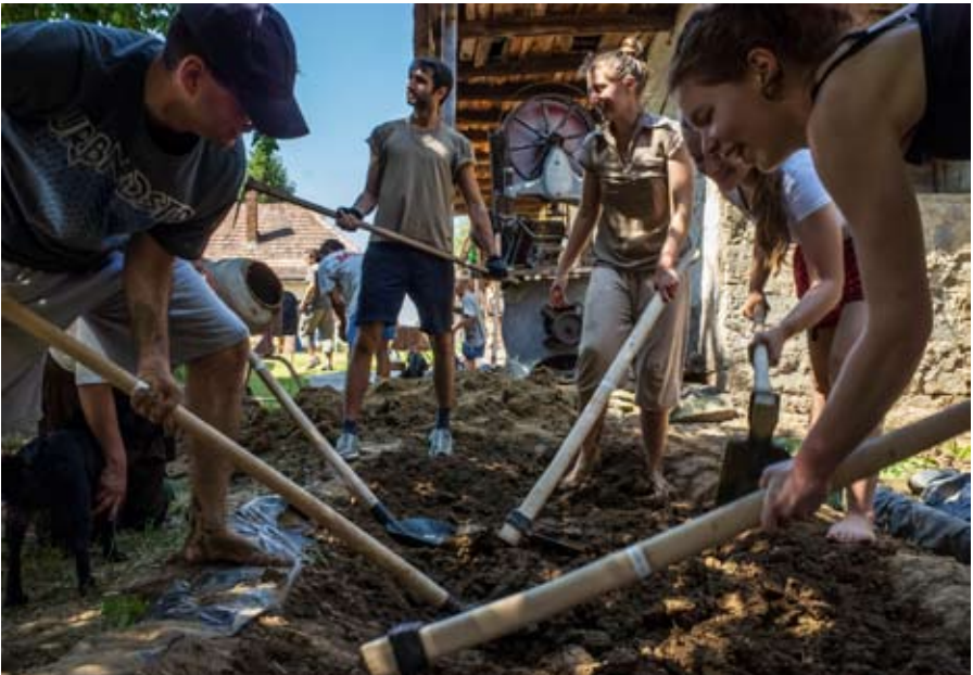
Épül a közösség