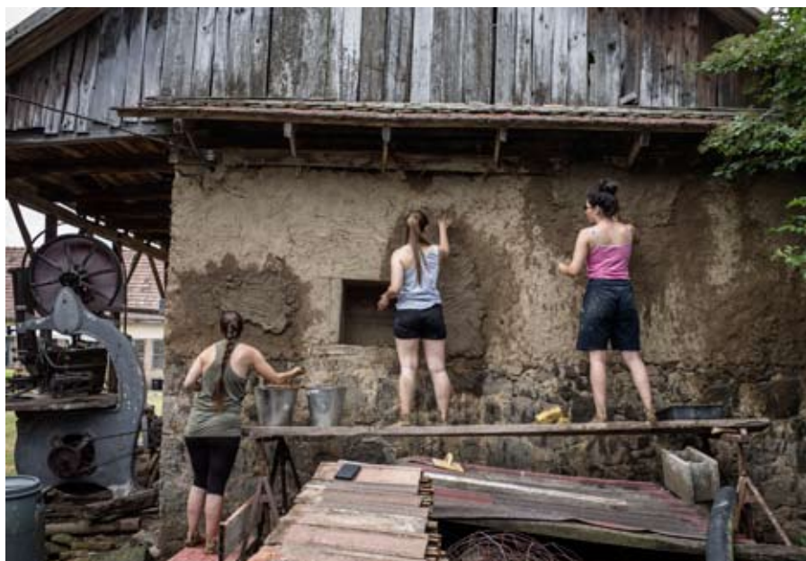
Tapasztás és tapasztalás