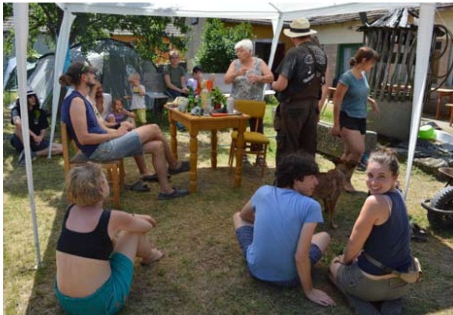
Generációk találkozója

A fizikai építés mellett azonban más is lezajlott, de ez már „belül történt, mi megesett”. A hét alatt egy rendkívül változatos csapat verődött össze, ahogy ezt a színes csoportképek is bizonyítják. Voltak bőven helyiek, volt, aki Budapestről csatlakozott, kit az építészeti oldal vonzott ide, kit a közösségi élmény ígérete, kit a néprajzi kutatás és gyakorlatba helyezésének vágya. Az épület szépülése mellett így a jövőben is gyümölcsöző kapcsolatok épültek és fontos találkozások zajlottak le. Ennek a vidékfejlesztő hatása se lebecsülendő, a helyiekkel is sok fontos és inspiratív, a jövőre is jelentős kihatással bíró beszélgetésnek volt jelen sorok írója is tanúja. A helyiek számára az integrált vidékfejlesztésben is oly fontos, inspiráló