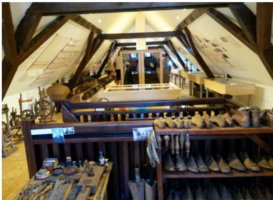
A tetőtéri kiállítás látképe