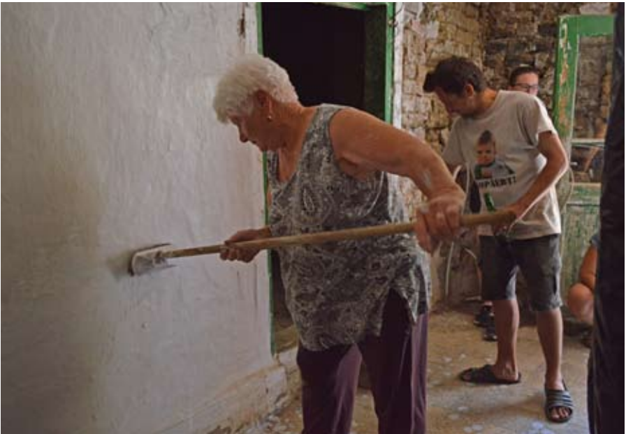
Meszelnéi tanulás – a gyakorlatban