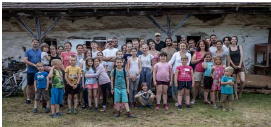
Az építőtábor és a gyerektábor közös csoportképe